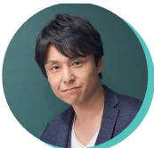
英語教育界の 革命児 関 正生